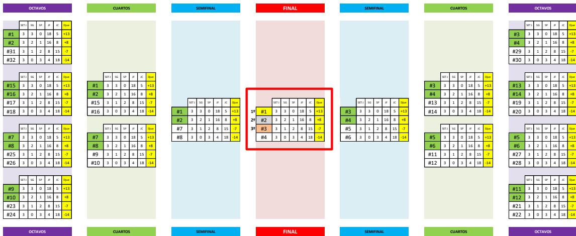
Ejemplo de Cuadro COPA FINAL BRS individual